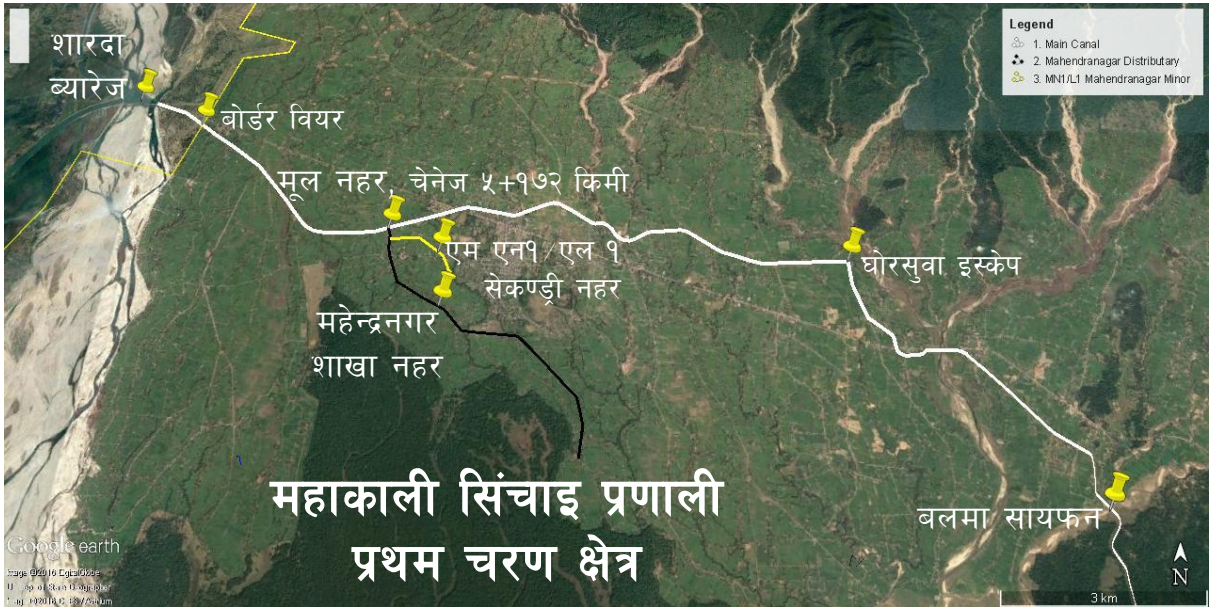
चित्र १ : महाकाली सिंचाइ प्रणाली प्रथम चरणको मूलनहर र महेन्द्रनगर शाखा नहर तथा एम एन १/एल १ सेकण्ड्री नहरको नक्शा

महेन्द्रनगर शाखा नहर महाकाली सिंचाइ प्रणाली प्रथम चरण क्षेत्रको ब्लक बी मा पर्दछ । यस शाखा नहरको चेनेज ०+२०० किलोमीटरबाट देब्रेपट्टि पूर्वतिर एकमात्र सेकण्ड्री नहर एम एन १/एल १ निस्केको छ । यस शाखा नहर उप-प्रणाली अन्तर्गत १८ वटा टर्सरी नहरहरू रहेका छन् । महेन्द्रनगर शाखा नहरको चेनेज ०+०२० किलोमीटरमा देब्रेपट्टि एउटा गेट नभएको आउटलेट र चेनेज ०+८८० किलोमीटरमा दाहिनेपट्टि एउटा तथा चेनेज ३+६२० किलोमीटरमा देब्रेपट्टि एउटा अर्को गरी दुईटा गेट भएको आउटलेटहरू रहेका छन् । एम एन १/एल १ सेकण्ड्री नहरको पुछारतिर महेन्द्रनगर बजार क्षेत्रमा पर्ने दुईवटा टर्सरी नहरहरू बन्द रहेका छन् ।