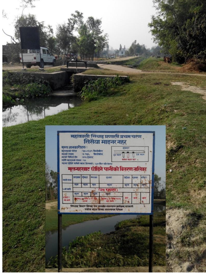
फोटो : सिसेया माइनर नहर हेड-रेगुलेटर