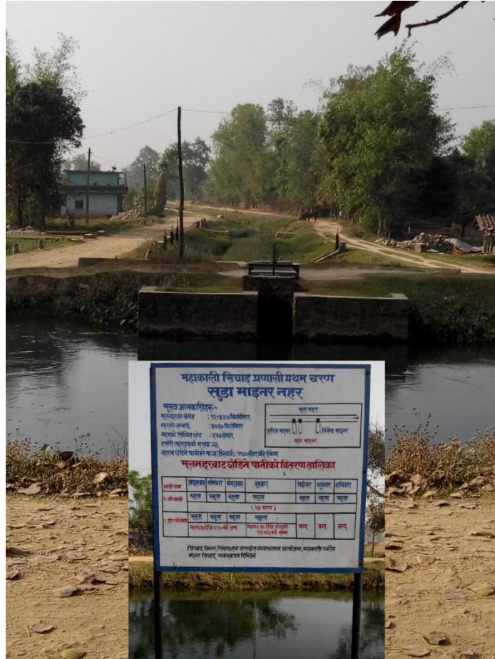
फोटो : सुडा माइनर नहर हेड-रेगुलेटर