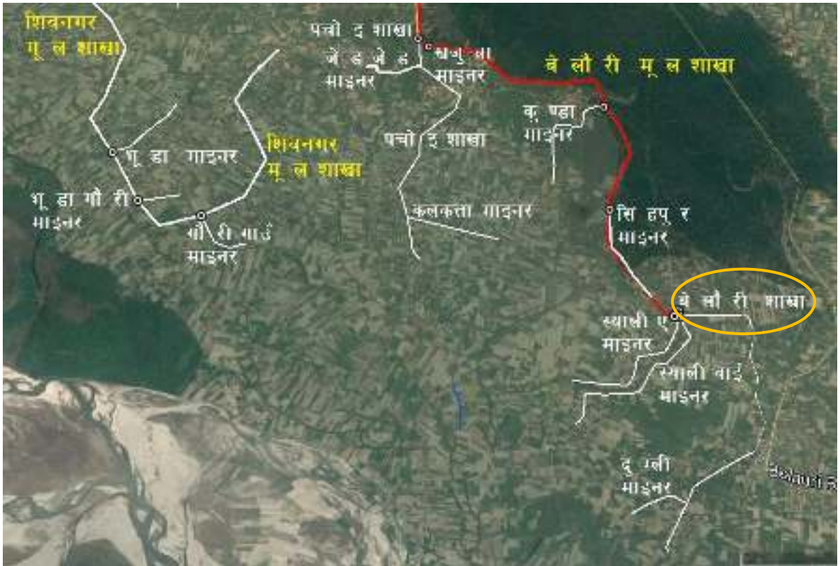
चित्र १ : महाकाली सिंचाइ प्रणाली द्वितीय चरणको बेलौरी मूल शाखा नहर र बेलौरी शाखा नहरको स्थिति नक्शा

महाकाली सिंचाइ प्रणाली द्वितीय चरण क्षेत्रमा बेलौरी शाखा नहरको स्थिति चित्र १ मा र बेलौरी शाखा नहरको ढाँचागत चार्ट चित्र २ मा देखाइएकोछ ।