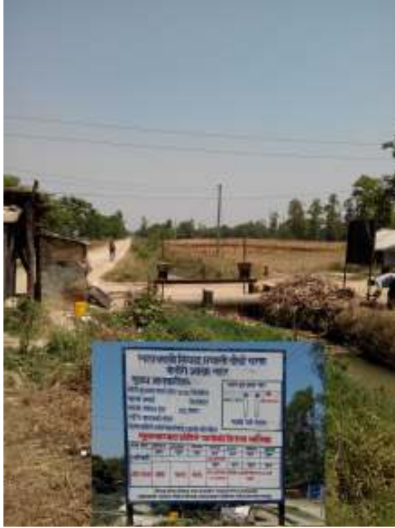
फोटो : बेलौरी शाखा नहर