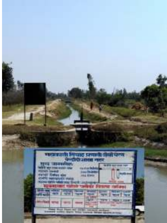
फोटो : बेलडाँडी शाखा नहर