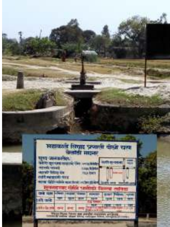
फोटो : बेलडाँडी माइनर नहर