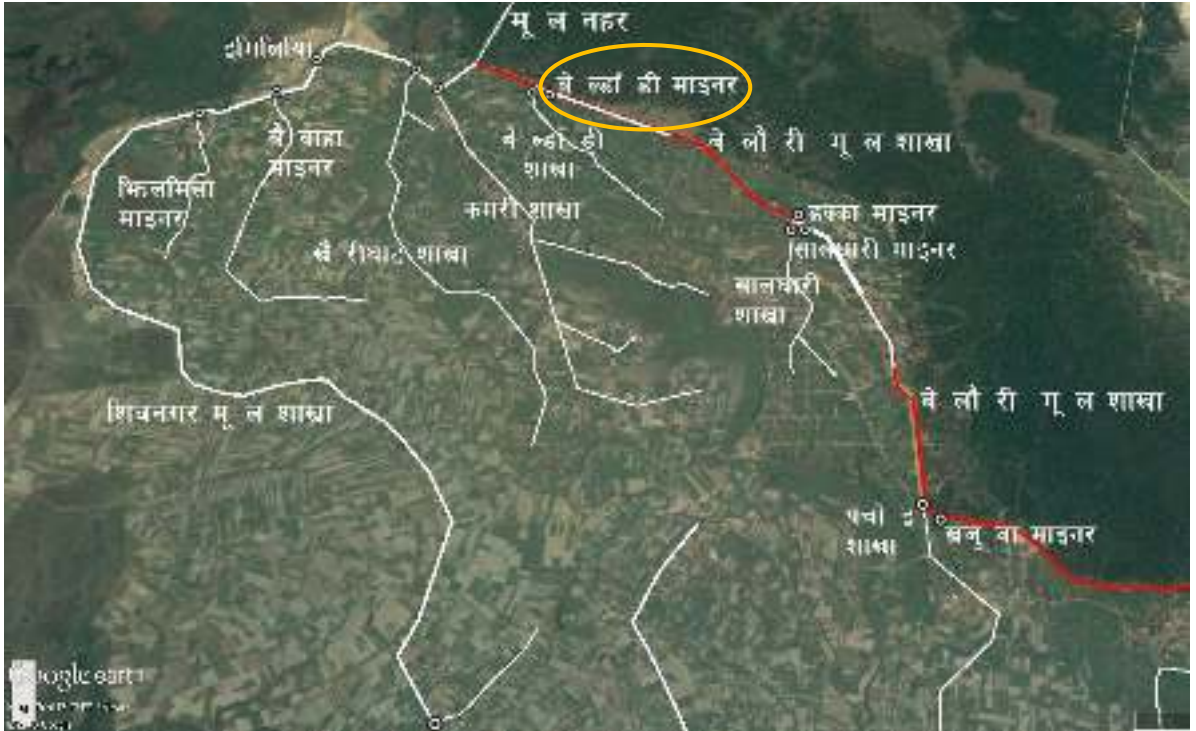
चित्र १ : महाकाली सिंचाइ प्रणाली द्वितीय चरणको बेलौरी मूल शाखा नहर र बेल्डाँडी माइनर नहरको स्थिति नक्शा

महाकाली सिंचाइ प्रणाली द्वितीय चरण क्षेत्रमा बेल्डाँडी माइनर नहरको स्थिति चित्र १ मा र बेल्डाँडी माइनर नहरको ढाँचागत चार्ट चित्र २ मा देखाइएकोछ ।