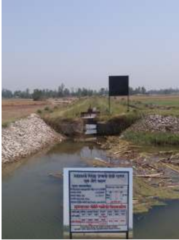
फोटो : भूडा गौरी माइनर नहर हेड-रेगुलेटर