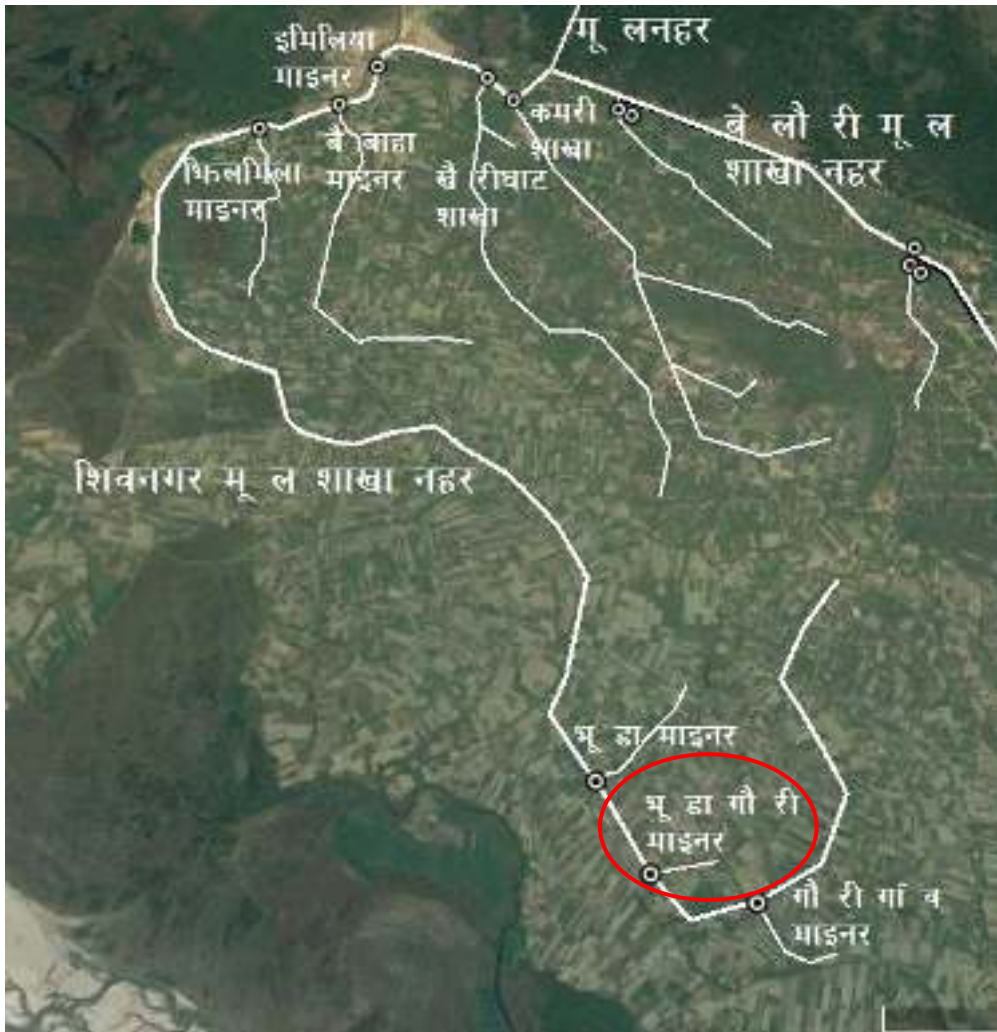
चित्र १ : महाकाली सिंचाइ प्रणाली द्वितीय चरणको शिवनगर मूल शाखा नहर र भूडा गौरी माइनर नहरको स्थिति नक्शा

महाकाली सिंचाइ प्रणाली द्वितीय चरण क्षेत्रमा भूडा गौरी माइनर नहरको स्थिति चित्र १ मा र भूडा गौरी माइनर नहरको ढांचागत चार्ट चित्र २ मा देखाइएकोछ।