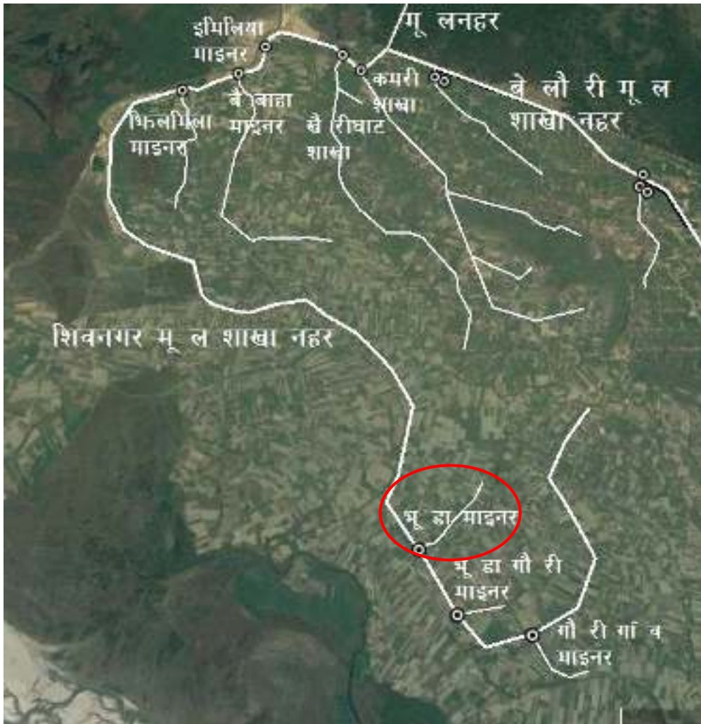
चित्र १ : महाकाली सिंचाइ प्रणाली द्वितीय चरणको शिवनगर मूल शाखा नहर र भूडा माइनर नहरको स्थिति नक्शा

महाकाली सिंचाइ प्रणाली द्वितीय चरण क्षेत्रमा भूडा माइनर नहरको स्थिति चित्र १ मा र भूडा माइनर नहरको ढाँचागत चार्ट चित्र २ मा देखाइएकोछ।