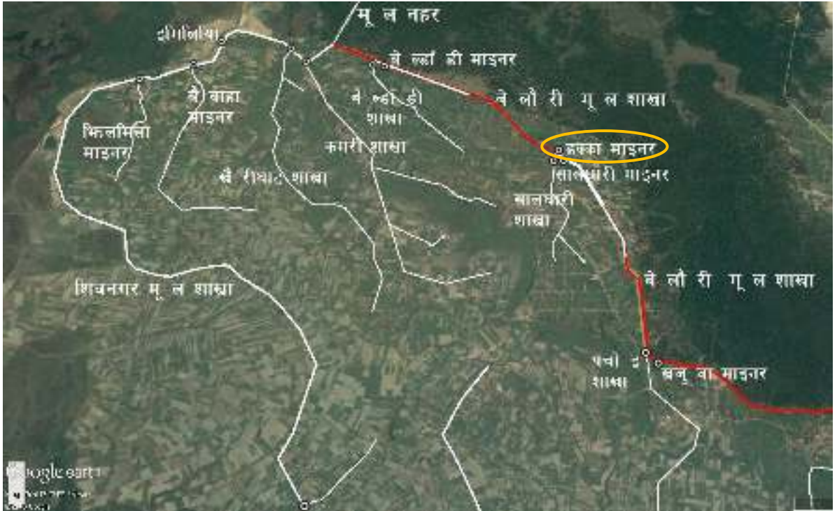
चित्र १ : महाकाली सिंचाइ प्रणाली द्वितीय चरणको बेलौरी मूल शाखा नहर र ढक्का माइनर नहरको स्थिति नक्शा

महाकाली सिंचाइ प्रणाली द्वितीय चरण क्षेत्रमा ढक्का माइनर नहरको स्थिति चित्र १ मा र ढक्का माइनर नहरको ढाँचागत चार्ट चित्र २ मा देखाइएकोछ ।