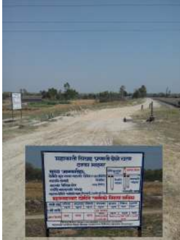
फोटो : ढक्का माइनर नहर