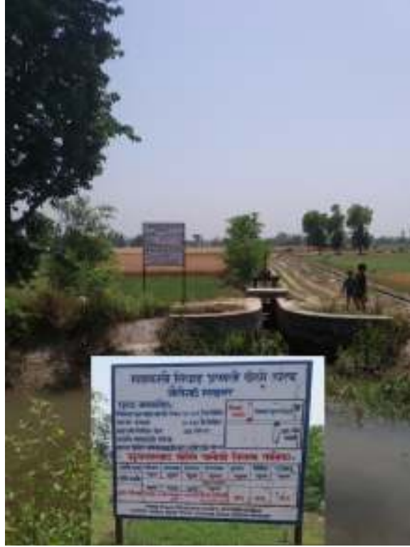
फोटो : गौरी गाउँ माइनर नहर हेड-रेगुलेटर