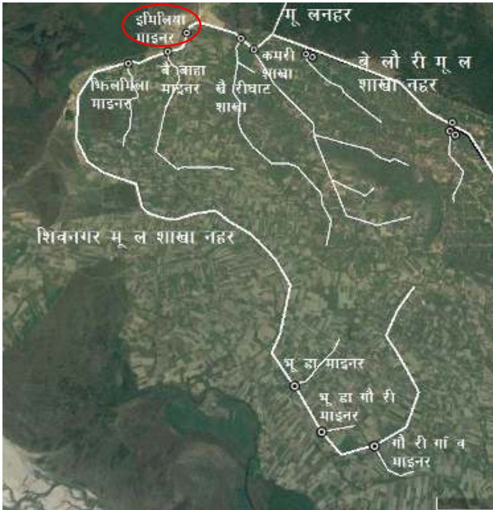
चित्र १ : महाकाली सिंचाइ प्रणाली द्वितीय चरणको शिवनगर मूल शाखा नहर र इमिलिया माइनर नहरको स्थिति नक्शा

महाकाली सिंचाइ प्रणाली द्वितीय चरण क्षेत्रमा इमिलिया माइनर नहरको स्थिति चित्र १ मा र इमिलिया माइनर नहरको ढाँचागत चार्ट चित्र २ मा देखाइएकोछ ।