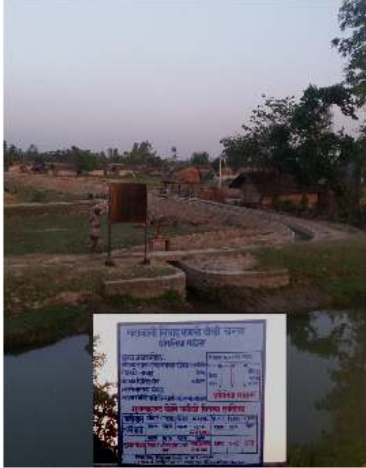
फोटो : इमिलिया माइनर नहर