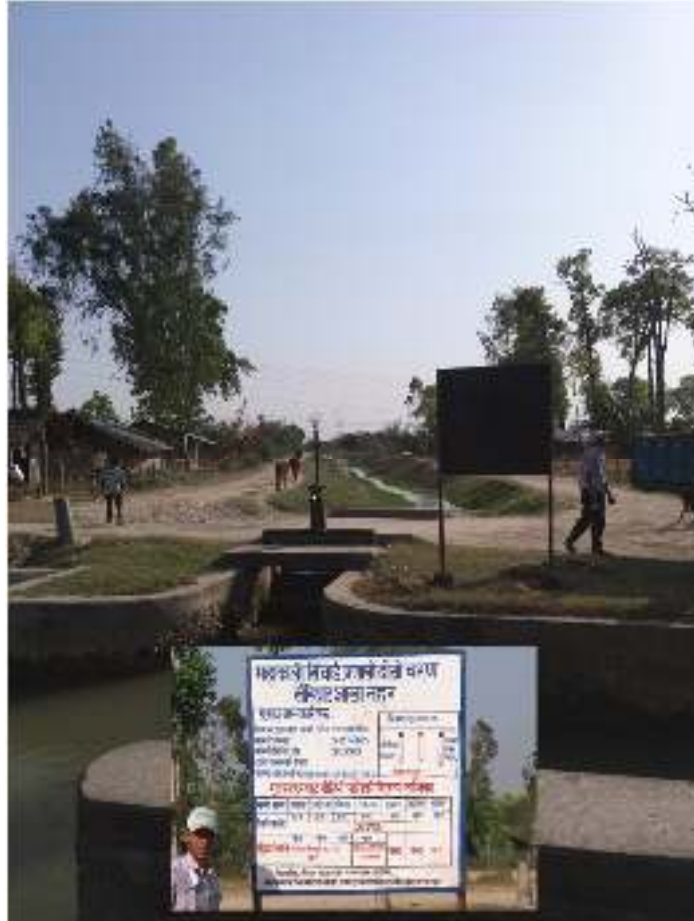
फोटो : खैरिघाट शाखा नहर