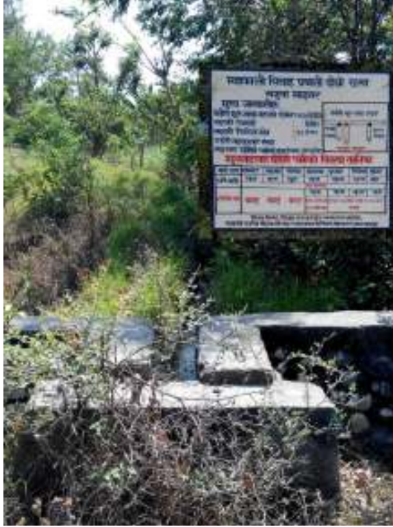
फोटो : खजुवा माइनर नहर