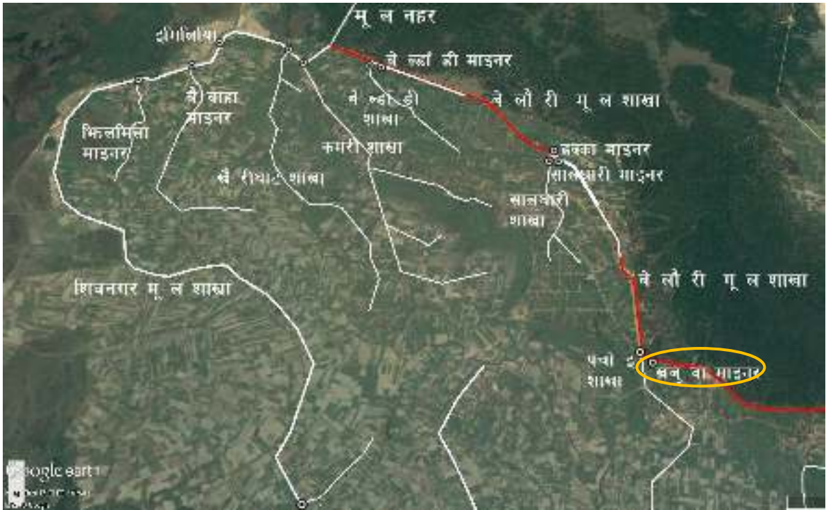
चित्र १ : महाकाली सिंचाइ प्रणाली द्वितीय चरणको बेलौरी मूल शाखा नहर र खजुवा माइनर नहरको स्थिति नक्शा

महाकाली सिंचाइ प्रणाली द्वितीय चरण क्षेत्रमा खजुवा माइनर नहरको स्थिति चित्र १ मा र खजुवा माइनर नहरको ढांचागत चार्ट चित्र २ मा देखाइएकोछ ।