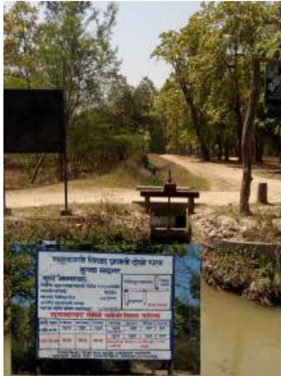
फोटो : कुण्डा माइनर नहर