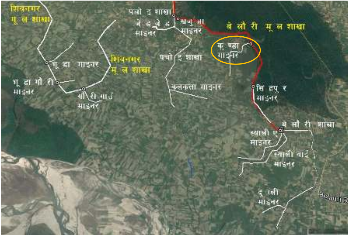
चित्र १ : महाकाली सिंचाइ प्रणाली द्वितीय चरणको बेलौरी मूल शाखा नहर र कुण्डा माइनर नहरको स्थिति नक्शा

महाकाली सिंचाइ प्रणाली द्वितीय चरण क्षेत्रमा कुण्डा माइनर नहरको स्थिति चित्र १ मा र कुण्डा माइनर नहरको ढाँचागत चार्ट चित्र २ मा देखाइएकोछ ।