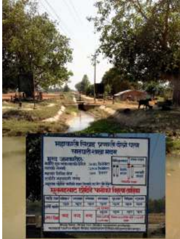
फोटो : सालघारी शाखा नहर