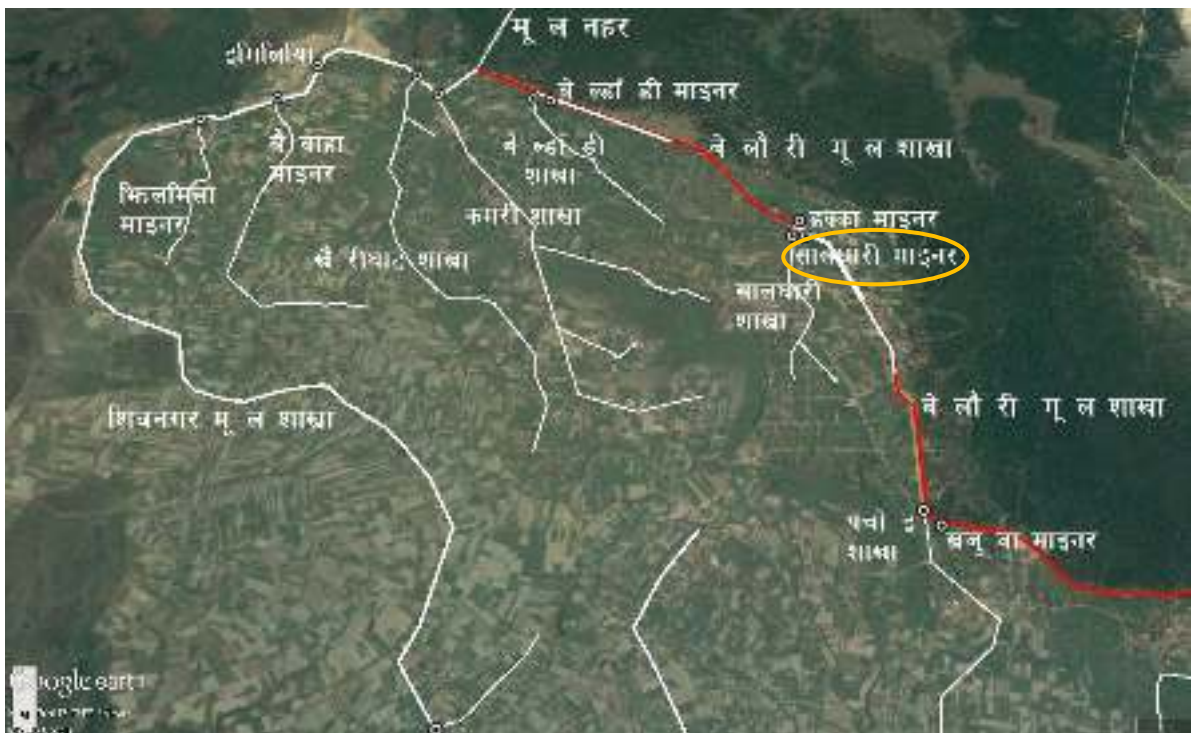
चित्र १ : महाकाली सिंचाइ प्रणाली द्वितीय चरणको बेलौरी मूल शाखा नहर र सालघारी माइनर नहरको स्थिति नक्शा

महाकाली सिंचाइ प्रणाली द्वितीय चरण क्षेत्रमा सालघारी माइनर नहरको स्थिति चित्र १ मा र सालघारी माइनर नहरको ढाँचागत चार्ट चित्र २ मा देखाइएकोछ ।