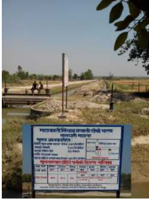
फोटो : सालघारी माइनर नहर