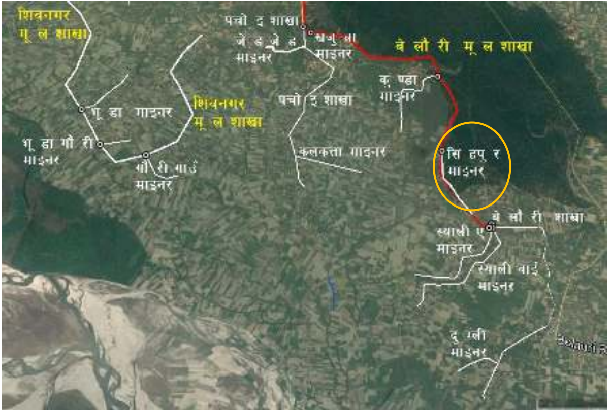
चित्र १ : महाकाली सिंचाइ प्रणाली द्वितीय चरणको बेलौरी मूल शाखा नहर र सिंहपुर माइनर नहरको स्थिति नक्शा

महाकाली सिंचाइ प्रणाली द्वितीय चरण क्षेत्रमा सिंहपुर माइनर नहरको स्थिति चित्र १ मा र सिंहपुर माइनर नहरको ढाँचागत चार्ट चित्र २ मा देखाइएकोछ ।