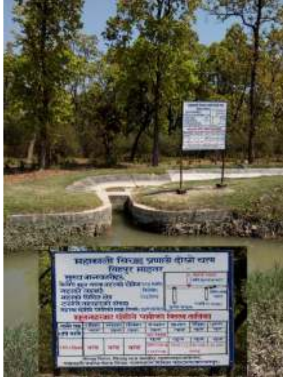
फोटो : सिंहपुर माइनर नहर