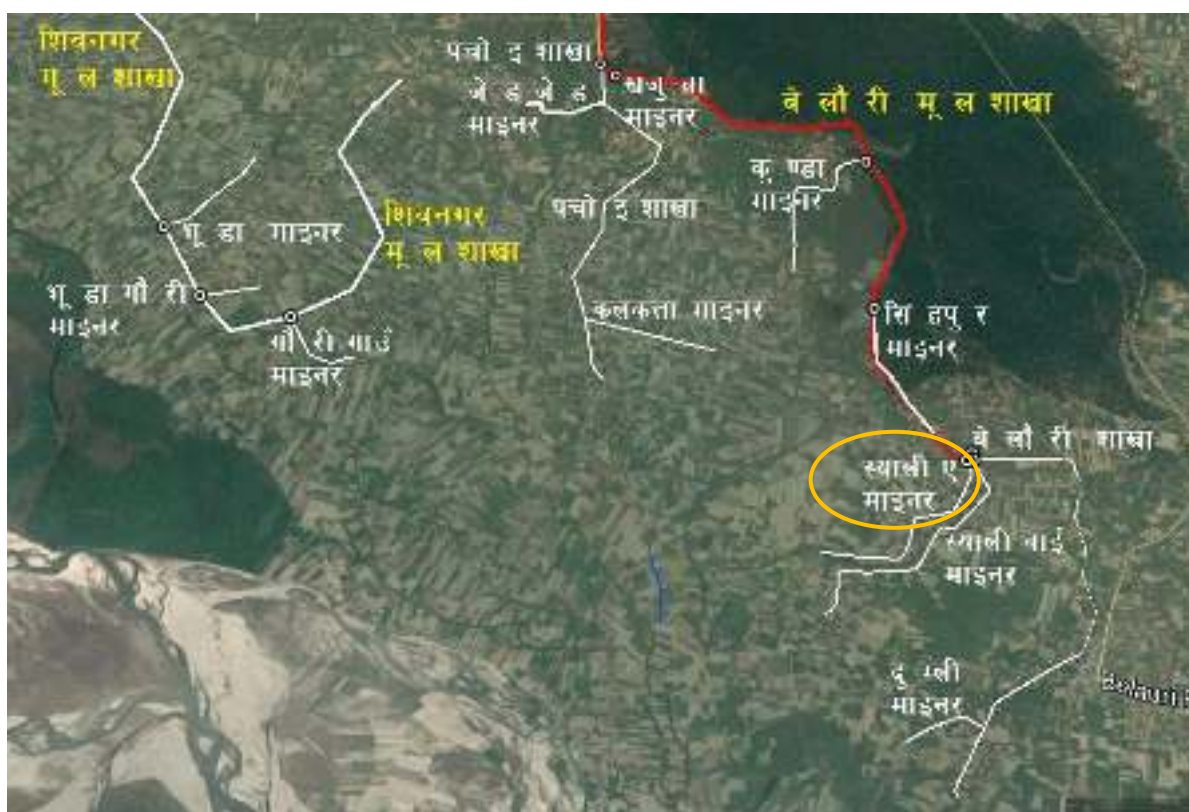
चित्र १ : महाकाली सिंचाइ प्रणाली द्वितीय चरणको बेलौरी मूल शाखा नहर र स्याली ए माइनर नहरको स्थिति नक्शा

महाकाली सिंचाइ प्रणाली द्वितीय चरण क्षेत्रमा स्याली ए माइनर नहरको स्थिति चित्र १ मा र स्याली ए माइनर नहरको ढांचागत चार्ट चित्र २ मा देखाइएकोछ ।