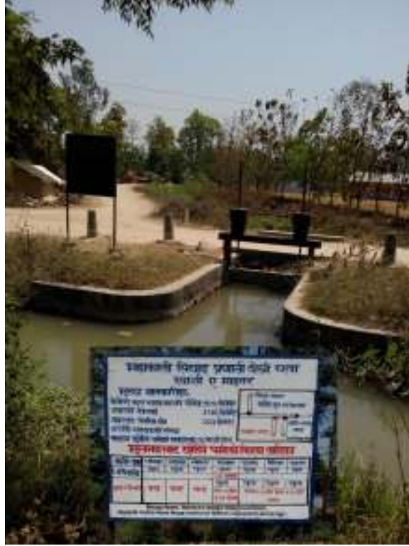
फोटो : स्याली-ए माइनर नहर