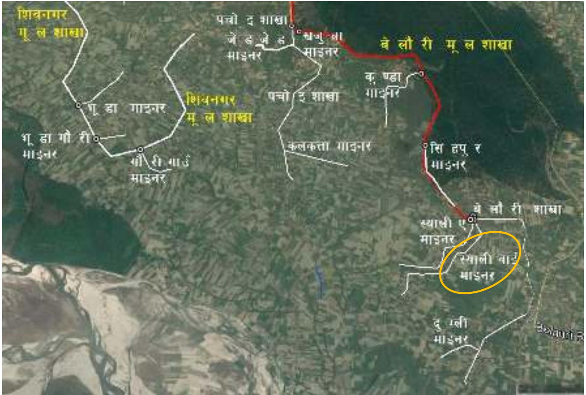
चित्र १ : महाकाली सिंचाइ प्रणाली द्वितीय चरणको बेलौरी मूल शाखा नहर र स्याली वाई माइनर नहरको स्थिति नक्शा

महाकाली सिंचाइ प्रणाली द्वितीय चरण क्षेत्रमा स्याली वाई माइनर नहरको स्थिति चित्र १ मा र स्याली वाई माइनर नहरको ढांचागत चार्ट चित्र २ मा देखाइएकोछ ।