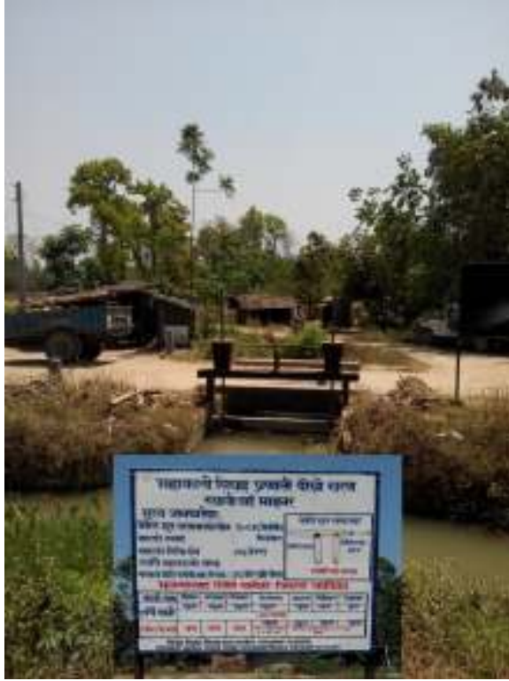
फोटो : स्याली-वाई माइनर नहर